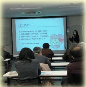
西多賀地域包括支援センター主催 「権利擁護勉強会」の様子

現実的に、今からどのような準備をしておく必要があるかというお声も多く いただき、関連する家族信託や任意後見に対する興味・関心の高さもうかが うことができました。今後の講話を行う際の、参考にさせていただきたいと思 います。西多賀地域包括支援センター様、大変ありがとうございました。