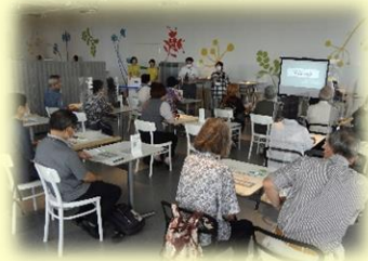
郡山地域包括支援センター主催 「権利擁護講座」の様子

今年度はこまで、地域包括支援センター主催の講座や自立支援協議会連絡会、 ロービジョン研究会などに出張してお話をしました。今回はそのうち 2 か所での様 子をご紹介します。